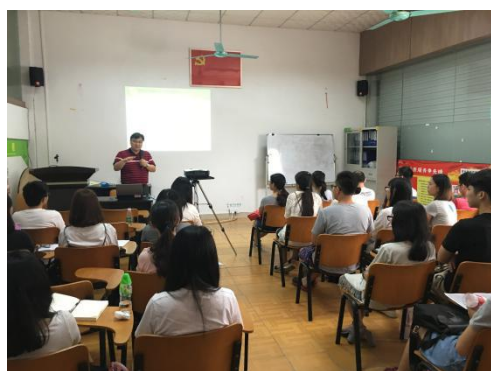
第四期入职初阶培训