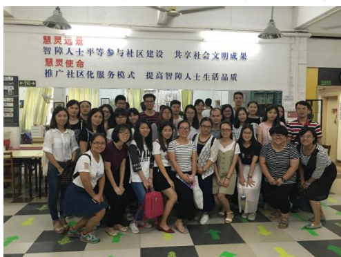
组织残康中心赴广州慧灵参观学习

机构根据 2016 年培训计划落实培训工作，除影子计划因社区综合服务中心的整体规划问题未如期开展外，其他培训计划皆获得落实：由督导委员会主持的机构内部培训 26 个，培训了 1007 人次；跟进各领域自主培训 29 个，培训了 369 人次；跟进同工参与外部培训 74 个，参与外部培训为 365 人次；到惠州巽寮湾组织退修营 1 次。通过上述培训有效提高了机构同工的整体理论和实务能力。